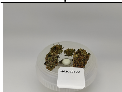
Foto del campione

Grado di umidità al momento dell'analisi - 11.41%