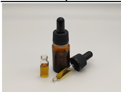
Foto del campione

LOD (Limit of Detection)**: 0,002% LOQ (Limit of Quantification)**: 0,005% **Per tutti i cannabinoidi